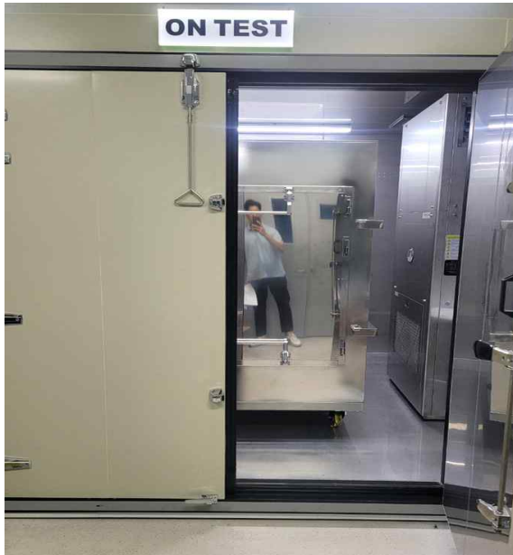
<실내 이중 체임버>